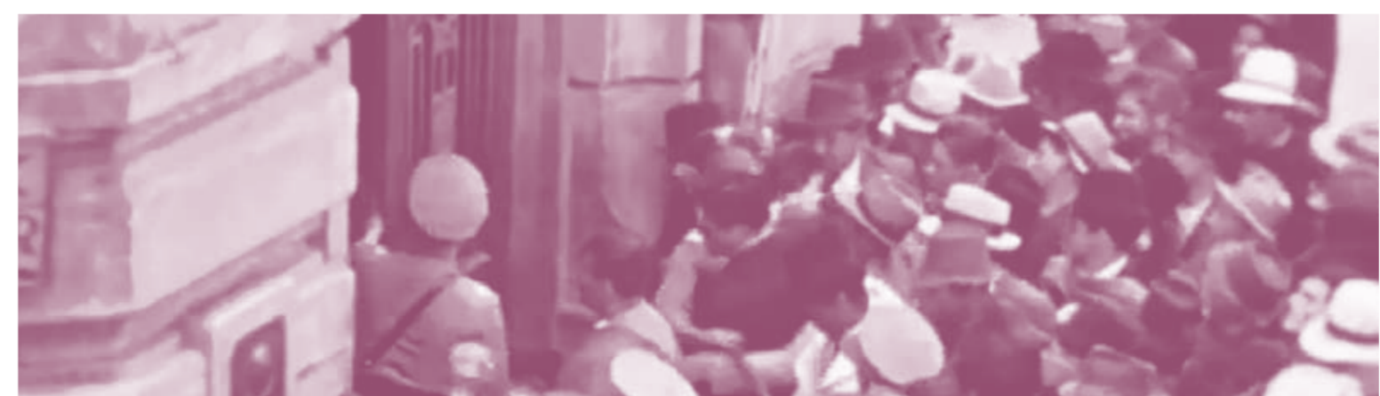
CESO LA HORRIBLE NOCHE

LOS RETRATOS (PORTRAITS). Dir. Iván D. Gaona. 2010. Colombia. CESO LA HORRIBLE NOCHE (THE HORRIBLE NIGHT CEASED). Dir. Ricardo Restrepo. 2012. Colombia. NELSA. Dir. Felipe Ovarero. 2012. Colombia. MONTAÑAS (MOUNTAINS). Dir. Sebastián Valencia. 2018. Colombia.