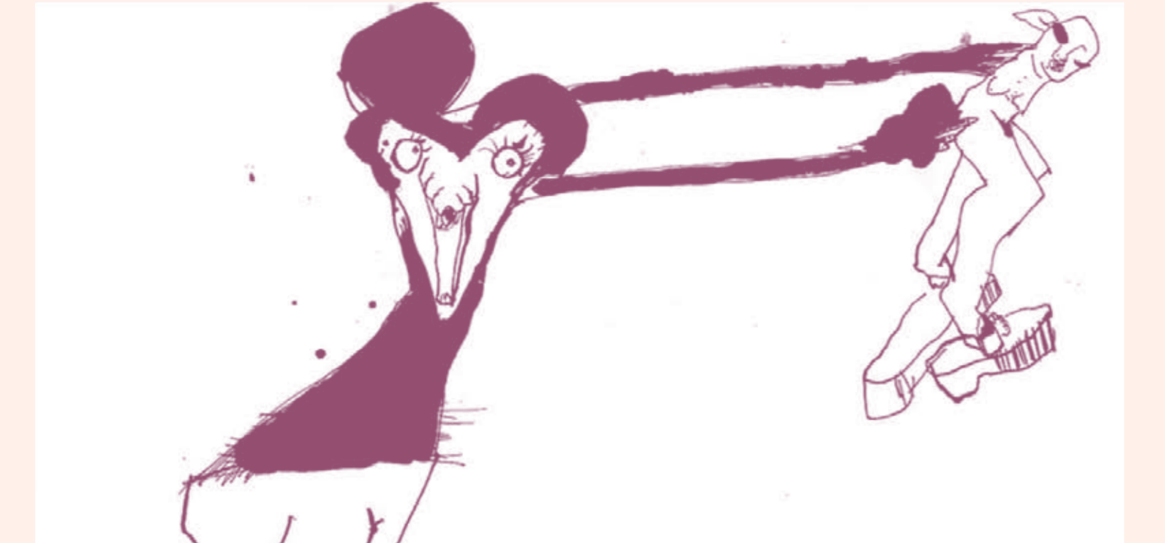
UNA FOSA COMÚN

1:00 p.m. / TAN CERCA (DE SI PRÉS). Dir. Rémi Durin. 2009. Francia. EL POZO (LE PUITS). Dir. Gabriel Le Bomin. 2001. Francia. A SUS HIJOS LA PATRIA AGRADECIDA (A SES ENFANTS LA PATRIE RECONNAISSANTE). Dir. Stéphane Landowski. 2015. Francia. CARTAS DE MUJERES (LET TRES DES FEMMES). Dir. Augusto Zanovello. 2013. Francia. TÓTEM - Sarah Arnold. 2014. Francia. COMO UN SOLO HOMBRE (COMME UN SEUL HOMME). Dir. Denis Dzarcz. 2015. Francia.